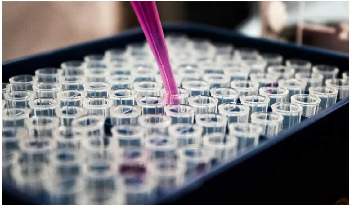
Neurologista diz que em breve será possível prever o risco de Alzheimer através de um simples exame de sangue

Historicamente, a detecção de biomarcadores no líquido cefalorraquidiano (LCR) por meio de punções lombares era o método mais preciso, embora invasivo. No entanto, a busca por métodos menos invasivos levou ao desenvolvimento de testes sanguíneos que, apesar dos desafios iniciais, agora oferecem resultados confiáveis. Esses testes utilizam técnicas como espectrometria de massa e anticorpos que se ligam às proteínas amiloide e tau, permitindo a detecção de sinais de