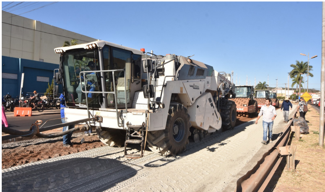
Recicladora é utilizada na obra de reconstrução da avenida Perimetral

Restrição de estacionamento: proibição de parada e estacionamento em toda a via vicinal da Avenida Perimetral