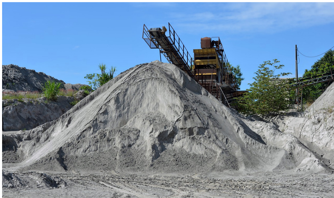
Remineralizador busca equilíbrio entre fertilidade e conservação do solo, fornecendo produtividade sustentável

nadora do PROREM-GO, Lívia Parreira, as ações da iniciativa incluem a análise das áreas de produção mineral e os tipos de resíduos gerados, o diagnóstico e mapeamento de laboratórios aptos para a caracterização mineralógica e estudos tecnológicos, além da validação da eficiência agrônômica para registro no Mapa.