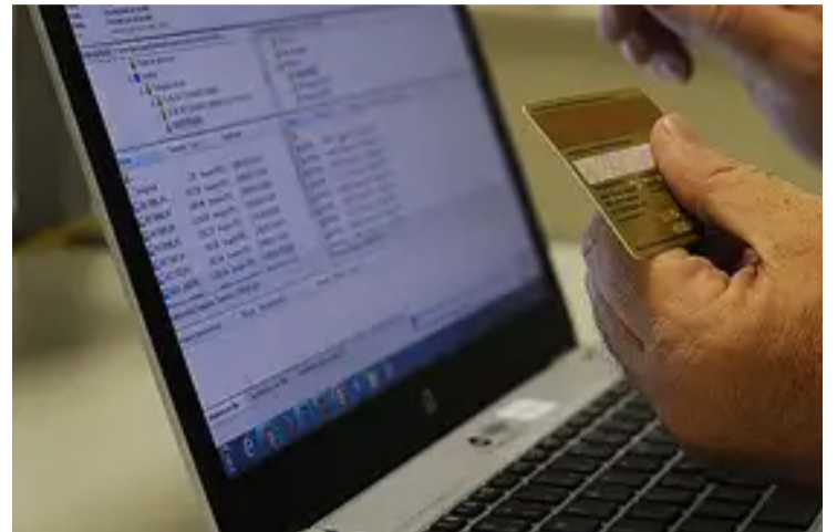
Apenas no primeiro semestre de 2024, o Brasil registrou um milhão de tentativas de fraude

Com o Dia dos Pais, 11, se aproximando, o aumento das promoções online somadas ao desejo de presentear cria oportunidades não só para os consumidores, mas também para os cibercriminosos