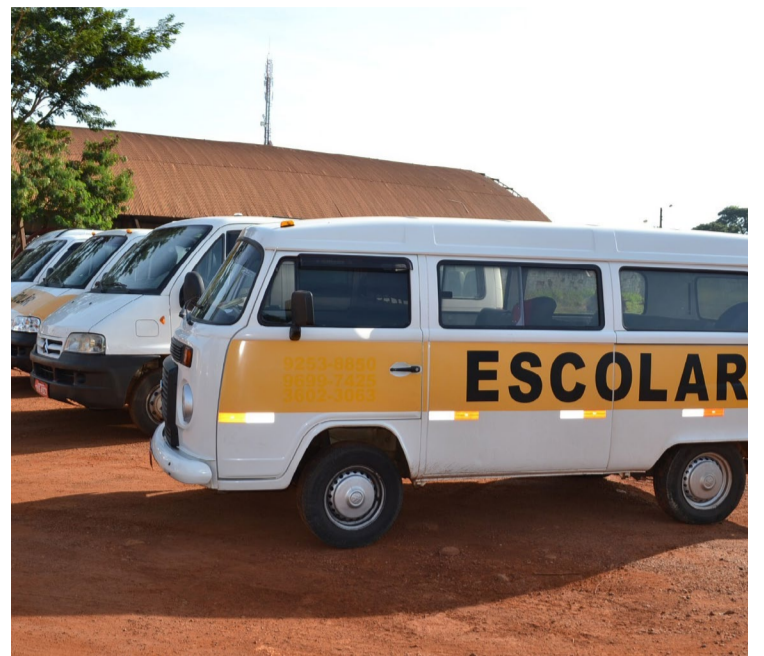
Transporte escolar em Rio Verde: início da prestação de serviço está previsto para a segunda quinzena de agosto

O último prazo para participar é nesta quinta-feira (08), portanto, as propostas devem ser enviadas para o e-mail: propostaemergencial2023@rio-verde.go.gov.br .