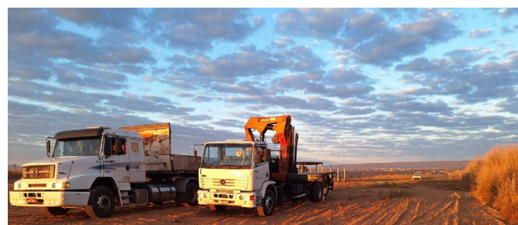
As obras devem ser concluídas em seis meses a partir do método “moldado in loco”

1,6 mil no Complexo Prisional Daniella Cruvinel, em Aparecida de Goiânia, com inauguração prevista para setembro. No Entorno do DF, a Unidade Prisional de Novo Gama ganhará 300 vagas até abril de 2025, enquanto o Presídio Estadual de Anápolis será ampliado com 150 vagas até dezembro deste ano, totalizando R$ 223 milhões em investimentos.