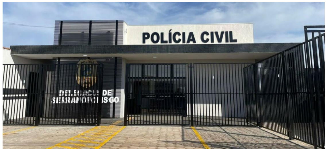
Um homem foi preso em Serranópolis por divulgar fotos íntimas de ex-companheira por vingança — Foto: Reprodução.

O número, claro, é só uma amostra. Porque, com certeza, muitos casos são subnotificados. Isso porque o constrangimento que as dores causadas na vítima fazem com que, ao