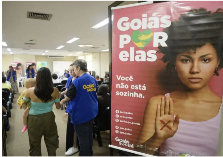
Governo Estadual anuncia garantia de amparo a mulheres vítimas de violência com ações em áreas que vão da moradia à segurança

Nos últimos anos, medidas implementadas pelo Governo de Goiás reforçaram a segurança das mulheres goianas. Em 2020, o governador estruturou o Batalhão Maria da Penha, que atualmente possui policiais que atuam na capital e no