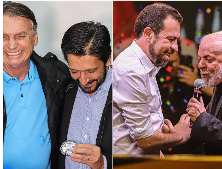
Jair Bolsonaro e Ricardo Nunes; Guilherme Boulos e Lula da Silva: disputa em São Paulo