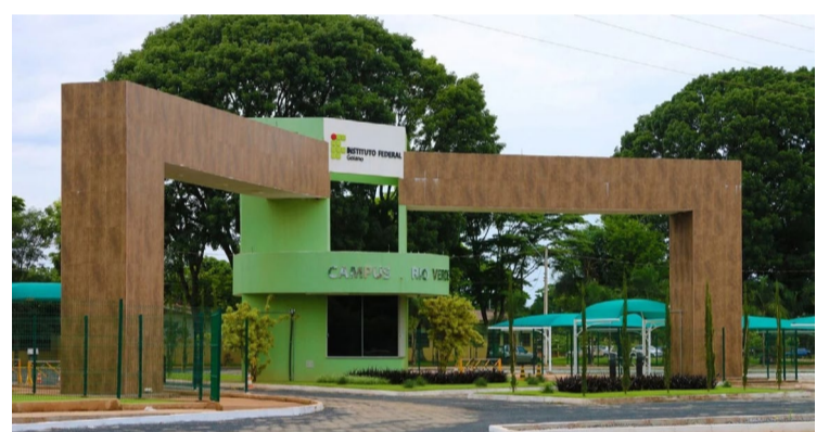
Inscrições para professor substituto do IFG Rio Verde termina em 15 de agosto — Foto: Reprodução.

O edital com esses e os demais dados mais detalhados, estão disponíveis no site oficial do IF Goiano Campus Rio Verde.