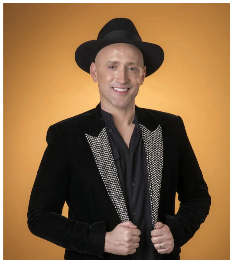
A Prefeitura Municipal de Jataí divulgou na última terça-feira (6), o resultado preliminar da segunda etapa do edital de fomento cultural

A Secretaria Municipal de Cultura disponibiliza diversos canais para esclarecimento de dúvidas. Os interessados podem agendar atendimento para o "Tira Dúvida Lei Paulo Gustavo" através do site oficial, ou pelo e-mail editais.cultura@jatai.go.gov.br e pelo WhatsApp (64) 3632-4140, com o assunto "Informações Edital Paulo Gustavo". O Centro Cultural Basileu Toledo França está localizado na Av. Goiás, 1433 - Vila Progresso.