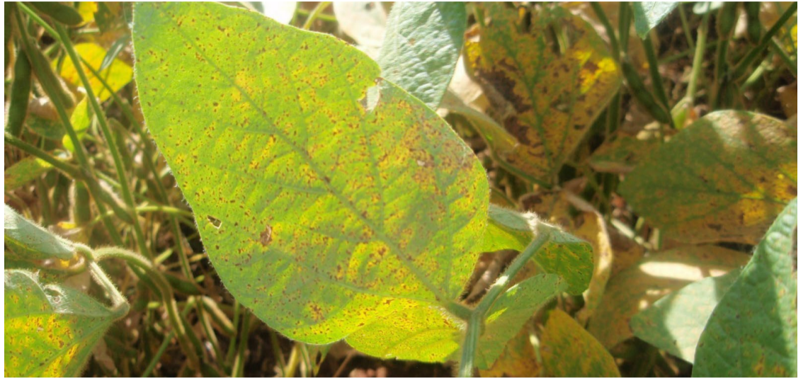
A Agrodefesa-GO publicou novas medidas para prevenção e controle da ferrugem asiática da soja

A gerente lembra ainda que a Instrução Normativa mantém a obrigatoriedade do cadastramento eletrônico das lavouras de soja no Sidago em até no máximo 15 dias após o término do calendário de semeadura. “Essa medida é importante para que os fiscais da Agrodefesa possam identificar as lavouras e orientar os produtores quanto às medidas legislativas