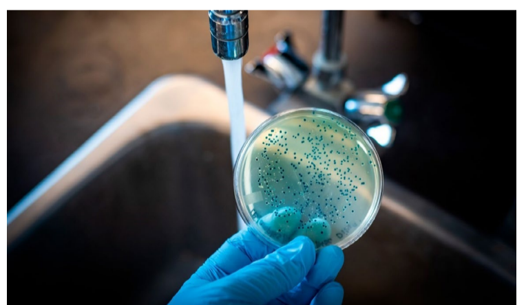
Segundo a SES, o município com maior número de casos notificados foi Campos Belos, com 1.130 ocorrências registradas — Foto: Reprodução.

Para prevenir a DDA, é fundamental adotar algumas medidas simples, como lavar as mãos com frequência, principalmente antes das refeições e após usar o banheiro; consumir água tratada e alimentos bem cozidos; manter os alimentos em locais adequados e protegidos de insetos, entre outros.